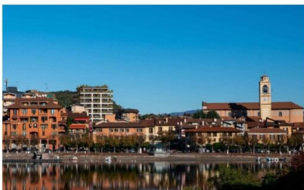
PROPOSTA MARZO 2023